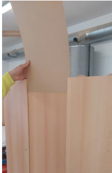
Ezután a vékony HDF hátlapokat becsúztatjuk az előre kialakított mélyedésbe.