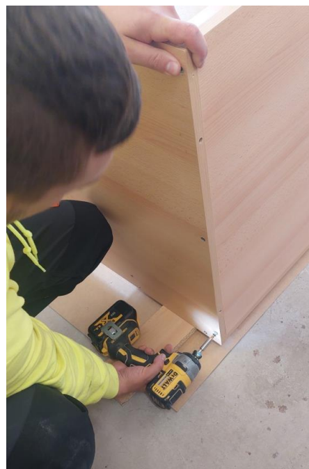
Összefogjuk az elemeket és a csavarokkal rögzítjük.