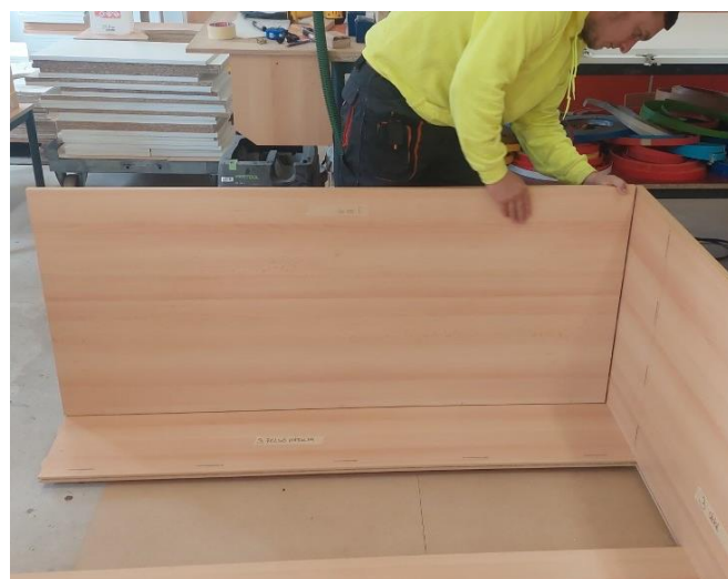
A 3 darab bútortlap hátfalelemet tiplik segítségével a tetőelemhez és az egyik oldalelemhez illesztjük.