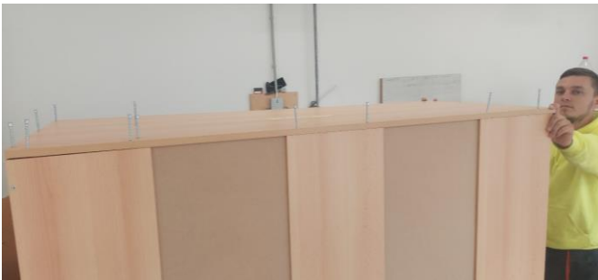
A majdnem kész szekrényre ráhelyezzük a másik oldalelemet és csavarokkal rögzítjük a tetőelemhez, a polchoz és a hátfelülelemekhez.