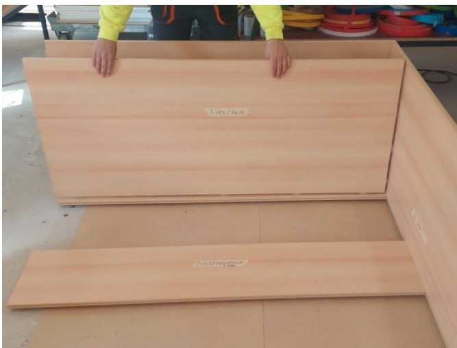
Ne felejtjük el a hátfalelemeket is az oldalelemhez csavarozni. Ezután a polcot helyezzük be a tiplik segítségével.