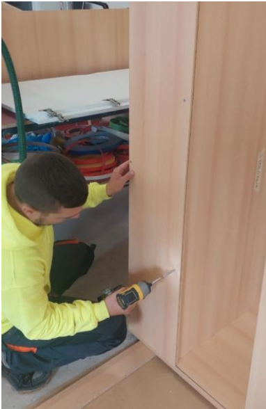
A polcot (képünkön hátulról) rögzítjük a legfelső hátlapelemhez csavarokkal. Ugyanígy a tetőelemet is rögzítjük.