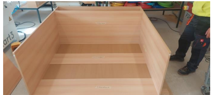
A szekrényt óvatosan visszadöltjük a hátára, majd felállítjuk a lábára.