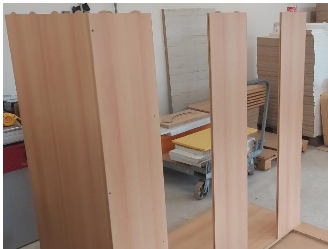
Óvatosan az oldalára fordítjuk a szekrényt.