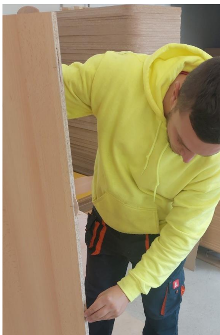
Az összes tiplik behelyezzük.